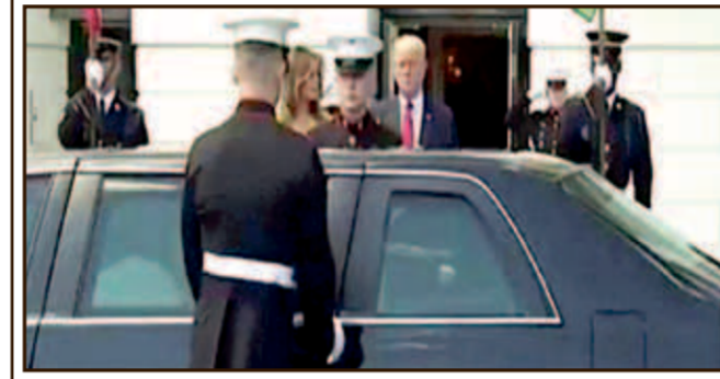
મોદીની કાર જેવી આવી કે મરિન ગાર્ડ્સ કારના બેઠિ દરવાજા ખોલવા દોડ્યા

વોશિંગ્ટન, તા. ૨૭: નરેન્દ્ર મોદી વ્હાઈટ હાઉસની મુલાકાતે ગયા ત્યારે ડોનાલ્ડ ટ્રમ્પના સિક્યોરીટી ગાર્ડ્સ ગેરસમજનો ભોગ બન્યા હતા. મોદીની કાર વ્હાઈટ હાઉસ આવતા જ ગાડીની બેઠિ બાજુએ દરવાજા ખોલવા બે મરિન ગાર્ડ્સ ઉભા રહી ગયા. ગાડીમાં બેઠેલા મોદીને સલામી આપ્યા બાદ બેઠિ ગાર્ડ્સ દરવાજા ખોલવા આગળ વધ્યા. મોદી ગાડીની જમણી સીટ પર બેઠા હતા. સામાન્ય રીતે નેતાઓની પત્નીઓ તેમની બરાબરવાળી સીટ પર બેસતી હોય છે. એક ગાર્ડ મોદીની સાઇડવાળો દરવાજો ખોલ્યો તો અન્ય ગાર્ડને લાગ્યું કે મોદી તેમની પત્ની સાથે આવ્યા છે એટલે તેણે બીજી બાજુનો દરવાજો પણ ખોલી દીધો. ગાર્ડને ડાબી બાજુનો દરવાજો ખોલતા ખાસ્સી મહેનત પડી હતી પણ દરવાજો ખુલ્યો તો જોયું કે ત્યાં કોઈ બંધુ ન હતું. આ ઘટનાનો વીડિયો બહાર આવતા લોકો સોશિયલ મીડિયા પર ઘણી મજાક કરી રહ્યા છે.